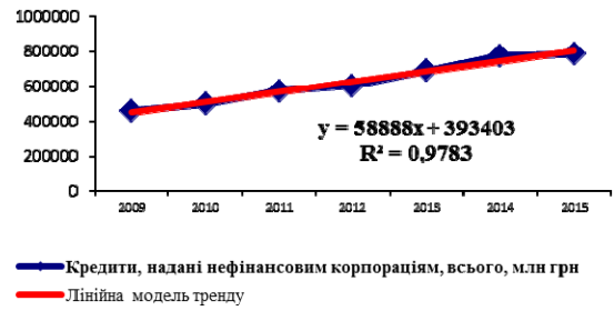
Рис. 2. Емпірична і теоретична лінія тренду кредитів, наданих нефінансовим корпораціям України за даними 2009–2015 рр. Побудовано за [10]

фінансування діяльності реально стає справді суттєвим джерелом фінансування діяльності нефінансових корпорацій країни.