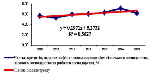
Рис. 4. Емпірична і теоретична лінія тренду частки кредитів, наданих нефінансовим корпораціям сільського господарства, лісового господарства і рибного господарства України за даними 2009–2015 рр. Побудовано за [10]

Графічний аналіз динаміки частки кредитів, наданих нефінансовим корпораціям сільського господарства, лісового господарства і рибного господарства України, у загальному обсязі банківських кредитів, наданих нефінансовим корпораціям (рис. 4) дозволяє стверджувати про існування тенденції до зростання цього досліджуваного показника фінансування сільського господарства.