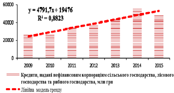
Рис. 3. Емпірична і теоретична лінія тренду кредитів, наданих нефінансовим корпораціям сільського господарства, лісового господарства і рибного господарства України за даними 2009–2015 рр. Побудовано за [10]

Надання банківських кредитів нефінансовим корпораціям сільського господарства, лісового господарства і рибного господарства України (рис. 3) за 2009–2015 р. також мало тенденцію до зростання, хоча і не так яскраво виражену.