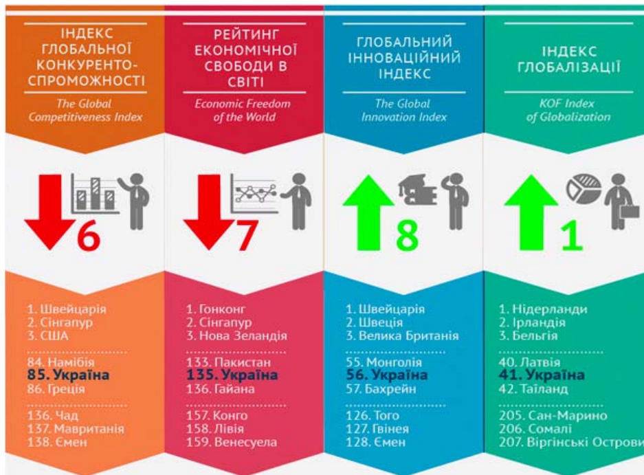
Рис. 3 Позиції України в глобальних рейтингах у співвідношенні 2016 : 2015

Інноваційність виробництва в ЄС перевищує 75%. З таким потенціалом євроінтеграційної привабливості не може зрівнятися ніхто.