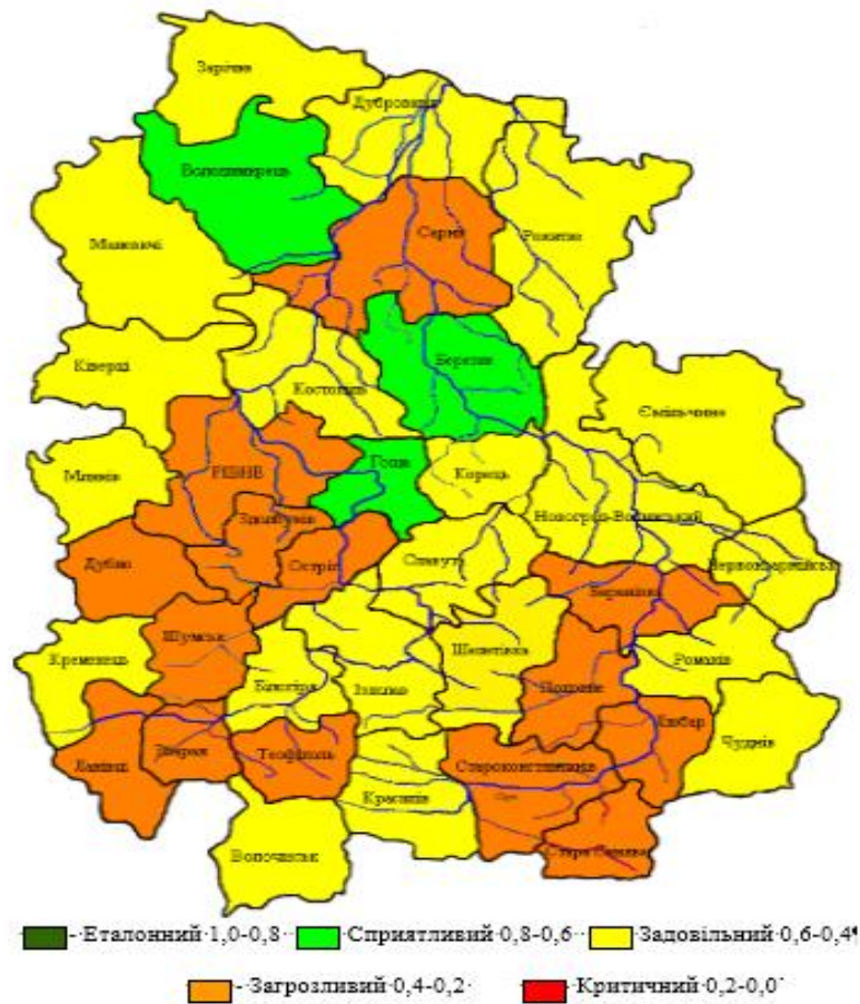
Рис. 2. Зонування території басейну річки Горинь за інтегрованим показником екологічного розвитку

Висновки. Виходячи з цього, можна стверджувати, що на території басейну річки не існує науково обгрунтованої стратегії її екологічного розвитку. Як результат маємо сучасну ситуацію, яка характеризується наближенням або перевищенням за окремими показниками меж стійкості природних систем.