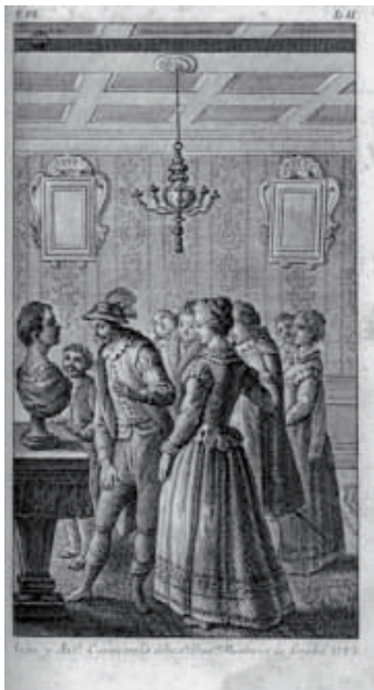
Ilustración del episodio en el Quijote según grabado de 1782.