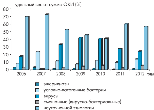
Рисунок 2. Этиологическая структура ОКИ новорожденных за 2006—2012 гг.

Во внутригодовой динамике заболеваемости суммарными ОКИ сезонные колебания сглажены. Подъем заболеваемости наблюдается в зимние месяцы (январь), затем в марте, в мае и продолжается все летние месяцы, достигая максимума в августе, и заканчивается в октябре. Продолжительность сезонного подъема составляет 8 месяцев. Анализ внутригодовой динамики заболеваемости различными нозологическими формами ОКИ выявил следующие особенности: эшерихиозы встречались в течение всего года, за исключением августа, когда среднегодовая заболеваемость была нулевой. На фоне единичных случаев наблюдалось увеличение среднемесячной заболеваемости в январе, мае, сентябре и ноябре. ОКИ, вызванные УПМ, также встречались в течение всего года с нечеткой летне-осенней сезонностью. Повышение заболеваемости начиналось с мая, продолжалось все летние месяцы, дости-