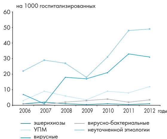
Рисунок 3. Динамика заболеваемости ОКИ новорожденных по нозологическим формам за 2006—2012 гг.

гало максимума в августе, в октябре наблюдалось снижение заболеваемости, затем вновь подъем в ноябре.