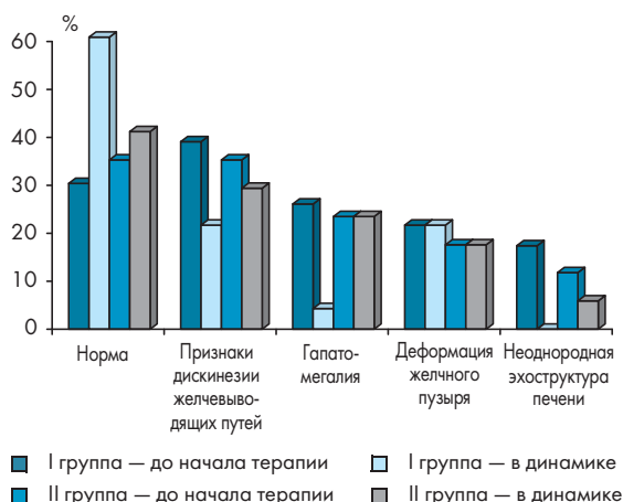
Рисунок 1. Варианты УЗ-картины печени у детей с хроническим вирусным гепатитом С в динамике

Побочных и нежелательных эффектов при проведении курса терапии препаратом ВИФЕРОН® у детей зафиксировано не было.