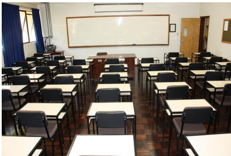
Figura 1 – Exemplo de sala de aula em estrutura matricial

Tais definições foram apresentadas por meio de uma intervenção com todos os alunos na sala do 1º ano “A” da escola em questão, com o apoio da professora responsável pela sala no momento da aplicação. Esse primeiro encontro foi marcado pela forte participação dos alunos. Notou-se, o envolvimento deles principalmente quando perceberam que o conteúdo, matrizes, poderia ser tranquilamente identificado e relacionado com o dia a dia dos discentes. Um momento importante da participação dos alunos se deu no instante em que, definindo matrizes, foi exibida para eles uma imagem (Figura 1) que expunha que até a própria sala de aula poderia ser entendida como exemplo de matriz.