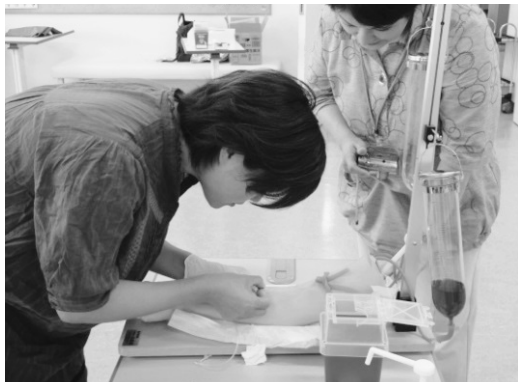
写真1 安全装置付き翼状針の操作