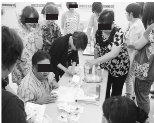
写真2 ビューバー針の使用法