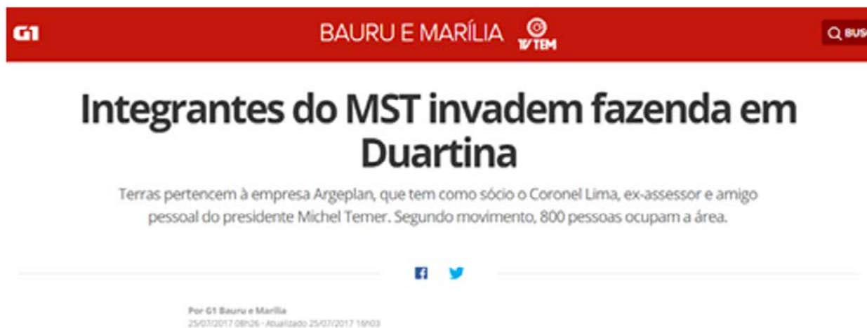
Figura 1 - Manchete de Notícia G1 – Integrantes do MST invadem fazenda em Duartina