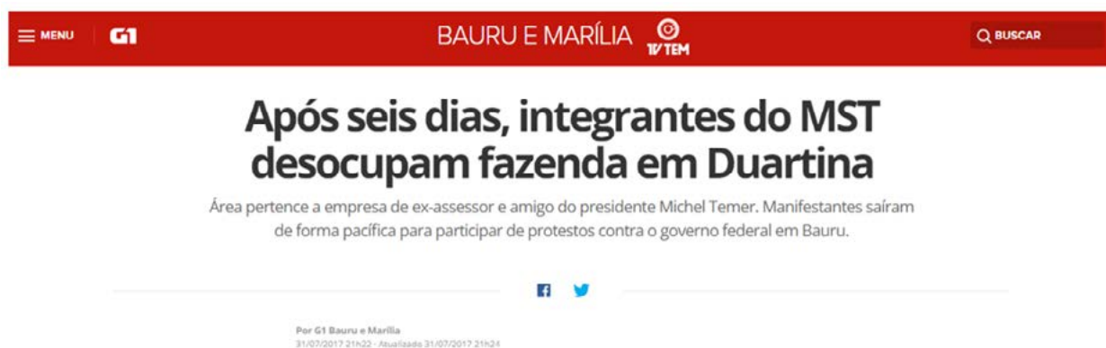
Figura 3 - Manchete de Notícia G1 – Após seis dias, integrantes do MST desocupam fazenda em Duartina

Já na seção “Danos”, os integrantes da ocupação são acusados de ações que caracterizam vandalismo (pichações, depredação e arrombamentos) e de furtar e matar cabeças de gado. Fala-se sobre a recorrência de ocupações na Fazenda Esmeralda pelos movimentos sociais, citando a Frente Nacional de Lutas (FNL) como fonte do número de pessoas presentes nas invasões , mais uma vez, deslegitimando os movimentos sociais e ameaçando suas faces.