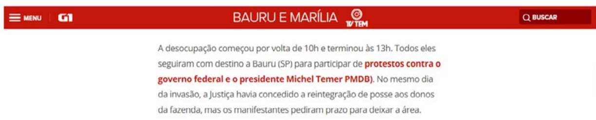
Figura 4 - Notícia veiculada no G1

Seguindo com a notícia, temos, no segundo parágrafo, um ato de ameaça à face do presidente Michel Temer. Com destaque em vermelho e direcionamento para outra notícia, os jornalistas “pessoalizam” o motivo do protesto, conforme é possível verificar na figura abaixo. Além disso, mais uma vez, temos a presença do léxico “invasão” para identificar a ação do MST.