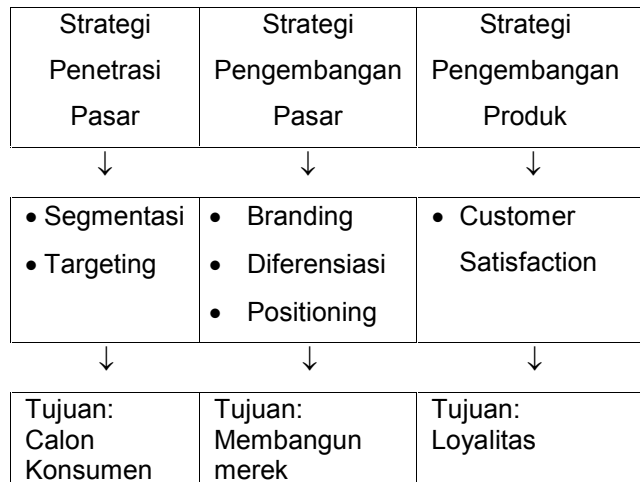
Gambar 1. Strategi Teknik Pemasaran

Dengan memilih dan memiliki strategi yang digunakan, para wirausaha mampu menyiapkan sebuah client brief yang dapat dijadikan acuan untuk menyusun alat-alat marketing. Dalam hal ini khususnya iklan, client brief merupakan ringkasan teknis yang berisi pengetahuan produk, kompetitor, keterangan perusahaan, jenis bidang usaha dan produk, penjadwalan, dan estimasi dana yang akan dikeluarkan. (Nugraha, 2011)