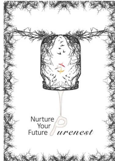
Gambar 7. Hasil Produksi Iklan dengan Strategi Free Association

Berikut adalah iklan yang dihasilkan dengan strategi free association . Kelompok kedua memikirkan nama produk dan mendeskripsikan dengan segala sesuatu yang muncul di pikiran. Sesuai dengan brief yang sudah didapatkan, kelompok kedua mengetahui bahwa kreatifitas yang dilakukan pemilik usaha dalam sisi produk adalah dengan menggunakan toples transparan yang kemudian divisualisasikan sebagai sarang burung wallet.