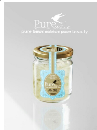
Gambar 5. Hasil Produksi Iklan dengan client brief

Berikut adalah iklan yang dihasilkan setelah mendapatkan client brief tanpa ada treatment mengenai strategi kreatif what if dan free association .