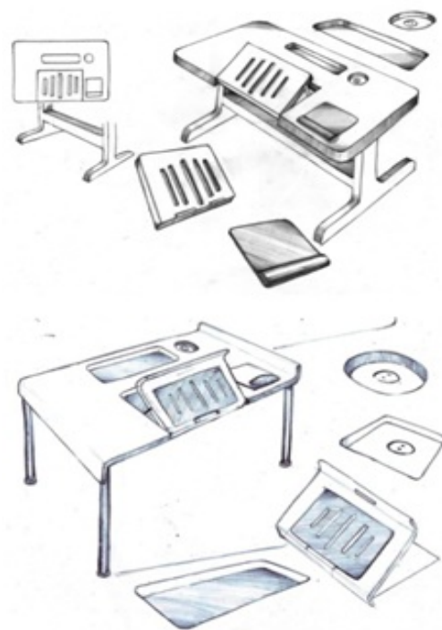
Gambar 4: Alternatif konsep meja laptop personal