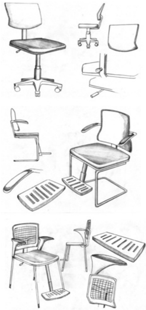
Gambar 3: Alternatif konsep kursi penggunaan laptop