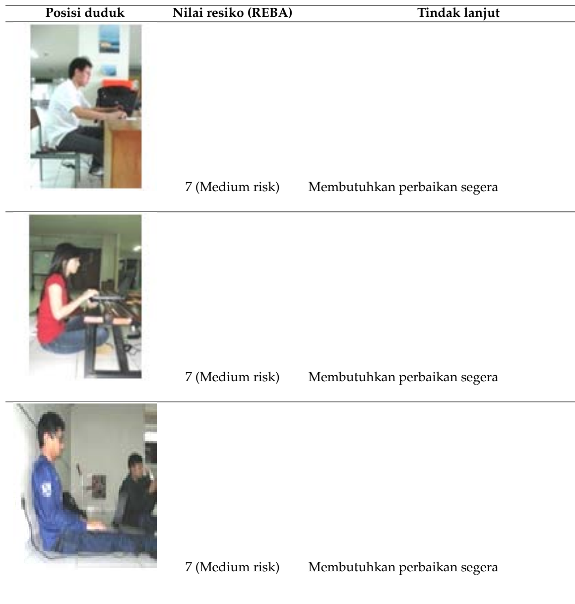
Tabel 2: Keluhan sakit responden akibat penggunaan laptop dengan posisi duduk kedua dan ketiga