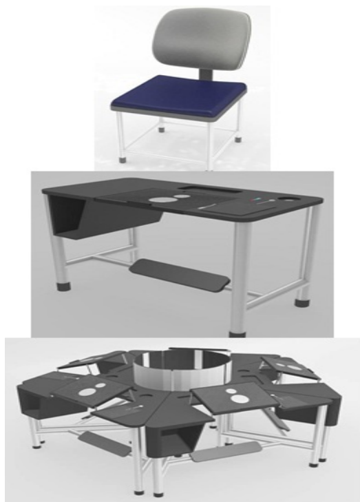
Gambar 6: Prototipe 3 dimensi dari rancangan kursi dan meja laptop