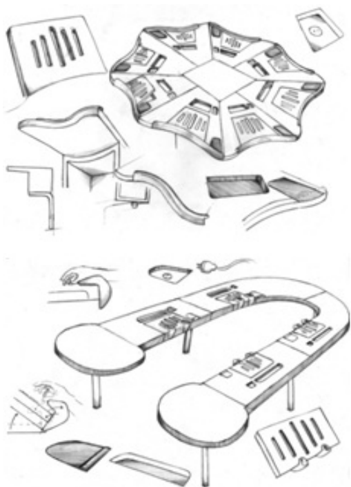
Gambar 5: Alternatif konsep meja laptop gabungan