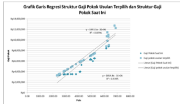
Gambar 3: Grafik Regresi Struktur Gaji Pokok Saat Ini dan Struktur Gaji Pokok Usulan Terpilih

gaji pokok dengan metode ini juga bukan yang terbaik, masih terdapat kekurangan juga. Tetapi jika dibandingkan dengan struktur gaji pokok saat ini, struktur gaji pokok usulan dapat dikatakan lebih baik karena struktur gaji pokok saat ini tidak menggunakan metode tertentu dan tidak ada strukturnya, hanya menurut penilaian masing-masing setiap jabatan dan gaji pokok industri sejenis serta UMR Kabupaten Bekasi. Selain itu metode point factor system lebih terbuka dalam penilaian dan lebih adil mengenai faktor dan sub faktor apa saja yang ingin digunakan untuk penilaian.