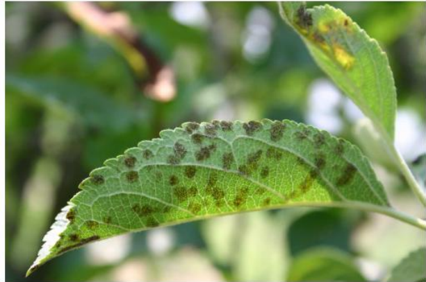
Abb. 1: Blattschorf

Die Bekämpfung des Apfelschorfes ( Venturia inaequalis ) ist in den Obstbaubetrieben, die nach ökologischen Richtlinien wirtschaften, von zentraler Bedeutung (Abb. 1). Ziel der Beratung und der Obstproduzenten ist es, die bestehenden Verfahren zu optimieren, um mit möglichst geringem Einsatz von Kupfer eine effektive Schorfbekämpfung zu erreichen. Durch Versuche konnte bereits bewiesen werden, dass die Anzahl der Applikationen auch im ökologischen Anbau durch gezielte Schorfbekämpfung nach Prognosemodellen mit CURATIO reduziert werden kann. Ebenfalls konnten in Versuchen mit niedrigen Kupferdosierungen mit der neuen Generation der Kupferhydroxidpräparate gute Bekämpfungserfolge verzeichnet werden.