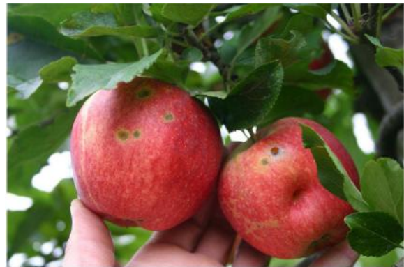
Abb. 4: Spätschorfbefall in kupferfreien Variante

(Staudenknöterich) konnte keine Wirkung auf den Schorfpilz festgestellt werden. Die neue Kupferformulierung CuCaps (mikroverkapseltes Kupfer (Kupferhydroxid)) wirkt bis 100 g Cu/ha stabil und ist regenfest, niedrigere Konzentrationen sind instabiler. In den Freilandversuchen wird getestet, inwieweit mit Alternativpräparaten eine verlässliche Wirkung gegen den Schorfpilz erzielt werden kann. Hieraus werden Praxisvarianten entwickelt, die aus der Kombination mehrerer Präparate bestehen. Diese werden dann in der jeweiligen Witterungssituation zum optimalen Applikationszeitpunkt eingesetzt. Hierbei erfolgen die Applikationen unter besonderer Berücksichtigung von Schorfprognosemodellen. In der Primärschorfphase 2014 wurde eine weitere Reduzierung der eingesetzten Kupferaufwandmenge bei Cuprozin progress um 20 % gegenüber der zugelassenen Mittelaufwandmenge in mehreren Versuchen überprüft. Hierbei zeigte sich, dass die Reduzierung der eingesetzten Kupferaufwandmenge in allen durchgeführten Versuchen zu einem deutlichen Mehrbefall führte. Auch in den Versuchen, in denen ganz auf den Einsatz von Kupfer bei der Schorfbekämpfung verzichtet wurde, wurde im Laufe der Sekundärschorfphase ein deutlich höherer Spätschorfbefall ermittelt (Abb. 4). Hierbei zeigte sich, dass durch die regenreichen Monate Juli und August ein regenstabiles Mittel, wie Kupfer, bei der Schorfbekämpfung bislang unerlässlich ist.