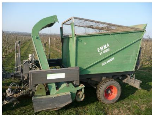
Abb.2: Laubsauger "Emma"

Hierzu zählen alle Maßnahmen, die das potentielle Ascosporenpotential in der Apfelanlage reduzieren. Grundvoraussetzung für eine erfolgreiche Schorfbekämpfung ist ein niedriges Ascosporenpotential im Frühjahr. Besonders in Jahren nach starkem Schorfbefall ist eine Reduzierung des Ascosporenpotentials sehr wichtig. Dies kann durch gezielte phytosanitäre Maßnahmen, wie z. B. Blattdüngung nach der Ernte im Herbst mit stickstoffhaltigen Düngern (z. B. Aminosol PS, Vinasse, Melasse), Häckseln des Falllaubes nach dem Blattfall erreicht werden. Alle diese Maßnahmen führen zu einer deutlichen Reduzierung des Ascosporenpotentials und somit zu einem geringeren Schorfdruck. Weiterhin lassen sich die im Frühjahr noch vorhandenen Blätter mit einem Laubsauger aus der Obstanlage entfernen (Abb. 2). Durch das Entfernen des Falllaubes mit dem Schorfinokulum, kann sich der Wirkungsgrad bei allen durchzuführenden Schorfbekämpfungen während der Vegetation erhöhen.