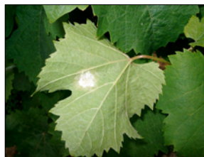
Rheinhessen, Nördliche Pfalz

→ 300 – 600 g Cu / ha und Behandlung (Cu-hydroxid – Cu-oxychlorid)