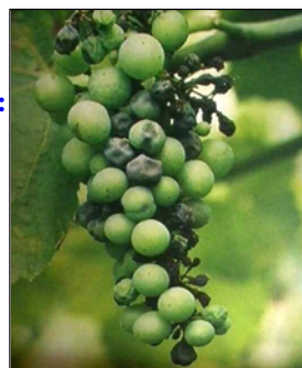
Mosel Südpfalz Baden Württemberg Baden