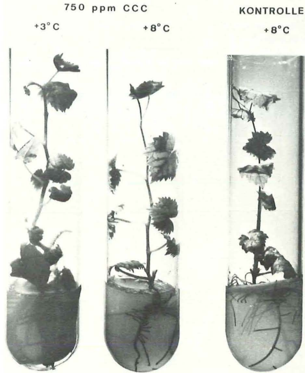
Abb. 3: Die Wirkung einer CCC-Applikation von 750 ppm auf die Vitalität der Explantate der Rebsorte Bacchus nach einer Lagerdauer von 10 Monaten.

Effect of a CCC application at 750 ppm on the vitality of explantates of cv. Bacchus after a storage period of 10 months.