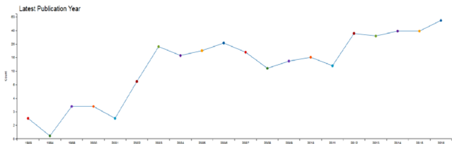
Abbildung 1: Patent Publikationen von 1989 bis 2016 (Suchbegriffe = Cynaroside oder Luteoloside oder C21H20O11 oder 5280637 oder Luteolin ADJ 7-glucoside oder Cinaroside oder luteolin-7-o-glucoside).

Das Flavonoid Cynarosid wurde in Paprikablättern nachgewiesen und weist antioxidative, antimikrobielle und Krebs-hemmende Eigenschaften auf (ŽEMLIČKA et al. 2014; PHUONG THUY et al. 2016; SA et al. 2015). In einer gemeinsamen Literatur- und Patentrecherche der beteiligten Projektpartner wurde Cynarosid als bioaktive Verbindung mit vielversprechenden Marktpotenzialen in der Kosmetik und pharmazeutischen Zubereitungen identifiziert. Cynarosid ist ein wichtiges Flavon in kommerziellen Extrakten (GEBHARDT, 1998), welches aus medizinischer Artischocke gewonnen wird, die in Deutschland nur für die Blatternte angebaut wird (ALI, 2011), oder auch aus japanischem Geißblatt ( Lonicera japonica ; Hu et al. 2015). Cynarosid verursacht eine Apoptose in verschiedenen Krebszelllinien (BASKAR et al. 2010, PHUONG THUY et al. 2016) und hat darüber hinaus antimikrobielle Eigenschaften vor allem gegen gramnegative Bakterien (SCHINOR et al. 2007; ŽEMLIČKA et al. 2014) sowie antioxidative Aktivität (ŽEMLIČKA et al. 2014; ODONTUYA et al. 2005; KUETE und EFFERTH, 2014). Es könnte aufgereinigt werden oder in angereicherten Extrakten Anwendung finden (aktueller Preis: ca. 160€ / 10 mg bei >98% Reinheit). Eine leichte, aber signifikante Zunahme von Patentanmeldungen zu Cynarosid impliziert, dass die Anzahl der unterschiedlichen Anwendungsmöglichkeiten voraussichtlich weiter wachsen wird (Abb. 1).