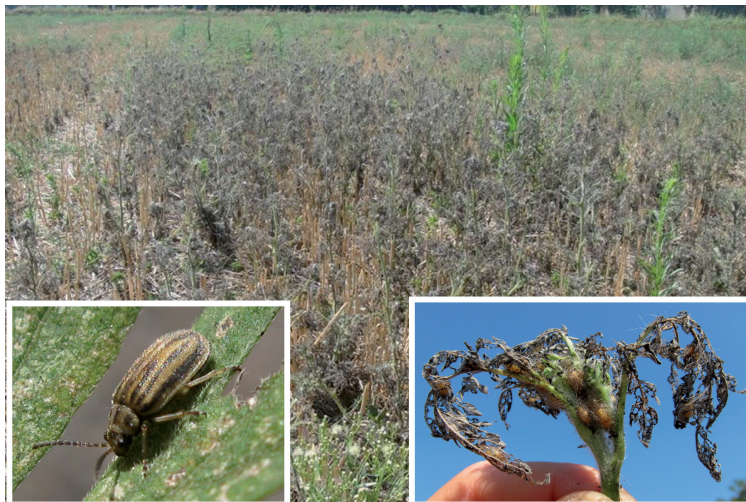
Abb. 2 Kulturland, das stark von Ambrosia artemisiifolia befallen ist. Die gelblichen Stoppeln des Getreides sind noch sichtbar, aber das Feld ist stark von Ambrosia -Pflanzen durchwuchert, die nach dem Befall durch den Blattkäfer Ophraella communa braun geworden sind. Linke Einlage: Adulter Käfer. Rechte Einlage: Spitze einer Ambrosia -Pflanze mit abgetrockneten Blättern und voller Käfer-Puppen.

Zu unserer Überraschung fanden wir im Sommer 2013 in der Südschweiz und in Norditalien einen großen Befall von Ambrosia -Populationen durch eine Blattkäfer-Art. Morphologische und genetische Analysen ergaben, dass dies Ophraella communa LESAGE (Coleoptera: Chrysomelidae) ist (BORIANI et al. , 2013; MÜLLER-SCHÄRER et al. , 2013), die in Nordamerika beheimatet und derzeit der effizienteste und erfolgreichste biologische Kontrollorganismus von Ambrosia in China ist (CHEN ET AL. , 2013). Während unseren Felduntersuchungen zur Verbreitung und Abundanz von Ambrosia fanden wir den Käfer bisher nur südlich der Alpen, jedoch bereits an mehr als 130 Standorten der Südschweiz (Tessin) und Norditaliens (Lombardei, Piemont und Emilia-Romagna) (MÜLLER-SCHÄRER et al. , 2013) (Abbildung 2).