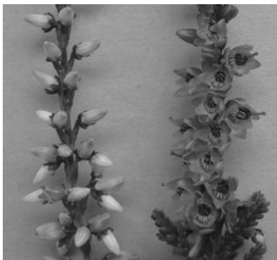
Abb. 1 Blütentriebe der Sommerheide ( Calluna vulgaris ); links: Knospenblüher, rechts: Einfachblüher (Wildtyp)

Calluna vulgaris zählt in Mittel- und Nordeuropa zu den wirtschaftlich wichtigsten Beet- und Balkonpflanzen für die Herbstbepflanzung (BEHR und NIEHUES, 2009). Im Vergleich zu anderen ökonomisch wichtigen Zierpflanzenkulturen ist C. vulgaris bisher aber noch nicht sehr intensiv züchterisch bearbeitet worden. Bisherige Züchtungsstrategien beschränken sich auf die Auslese von zufälligen Mutanten und einfache Kreuzungspläne. In mehreren aufeinanderfolgenden Forschungsprojekten wurde daher daran gearbeitet, ein systematisches Züchtungsverfahren insbesondere für die wichtige Sortengruppe der sogenannten Knospenblüher von C. vulgaris (Abbildung 1) zu entwickeln, wobei auch die Nutzung molekularer Marker einbezogen wurde. Molekulare Marker werden in der Pflanzenzüchtung im Wesentlichen für zwei unterschiedliche Zwecke eingesetzt: Zum einen dienen sie der Marker-gestützten Selektion („marker-assisted selection“ – MAS), zum anderen der Untersuchung der genetischen Distanz verschiedener Individuen. Beide Ziele wurden auch bei den Arbeiten mit C. vulgaris verfolgt. Einerseits wurde die Größe des genetischen Pools untersucht und ein Verfahren zur Identifikation sogenannter „abgeleiteter Sorten“ entwickelt. Andererseits sollten molekulare Marker für das ökonomisch wichtige Merkmal „Knospenblütigkeit“ gefunden werden, die eine Selektion auf dieses Merkmal bereits im Jungpflanzen-stadium ermöglichen.