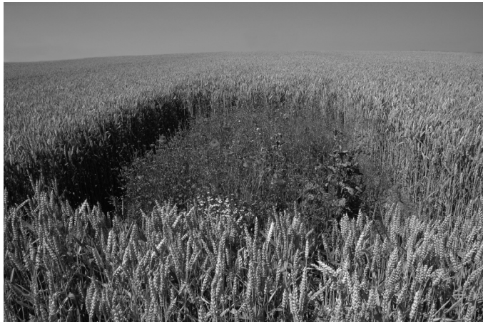
Abb. 2 Ein sogenanntes Feldlerchenfenster im Winterweizen: Kleinflächen von 3 m x 6 m, die statt mit Weizen mit einer Wildblumenmischung angesät wurden.

Unsere Erfahrung zeigt, dass viele Landwirte wenig auf allgemeine Überlegungen, wie sie in einem Punktesystem zu Grunde liegen, reagieren. Hingegen sprechen sie sehr positiv auf konkrete Maßnahmen zu Gunsten einer attraktiven (Tier-)Art an. Ein eindrückliches Beispiel dafür ist das Feldlerchenprojekt der IP-SUISSE und der Schweizerischen Vogelwarte: Rund ein Viertel aller IP-SUISSE Getreidebauern legen freiwillig und ohne Entschädigung so genannte Feldlerchenfenster an (Abb. 2) oder praktizieren Weitsaat, bei der auf 5 % des Getreidefeldes jeweils zwei von fünf Saatscharen geschlossen bleiben (Jenny 2004).