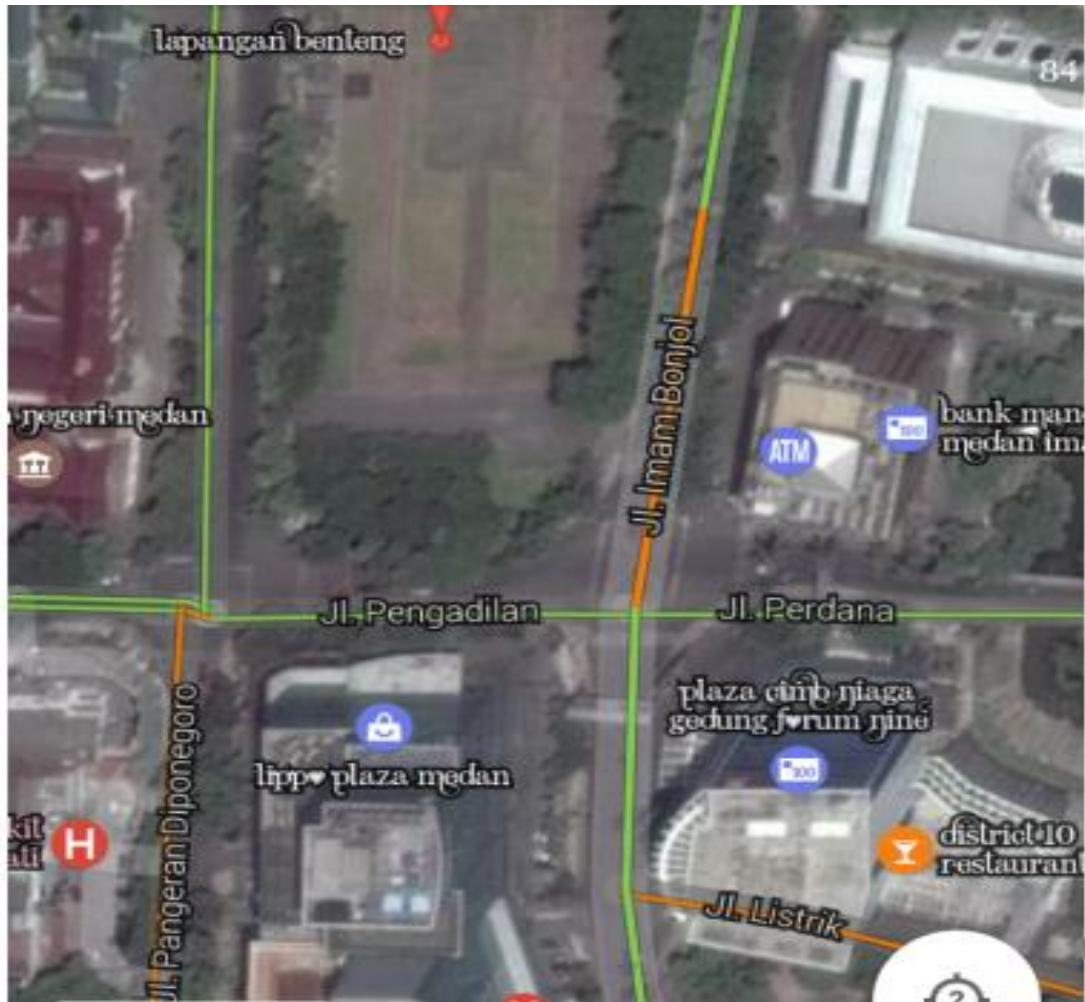
Gambar 2. Lokasi Studi