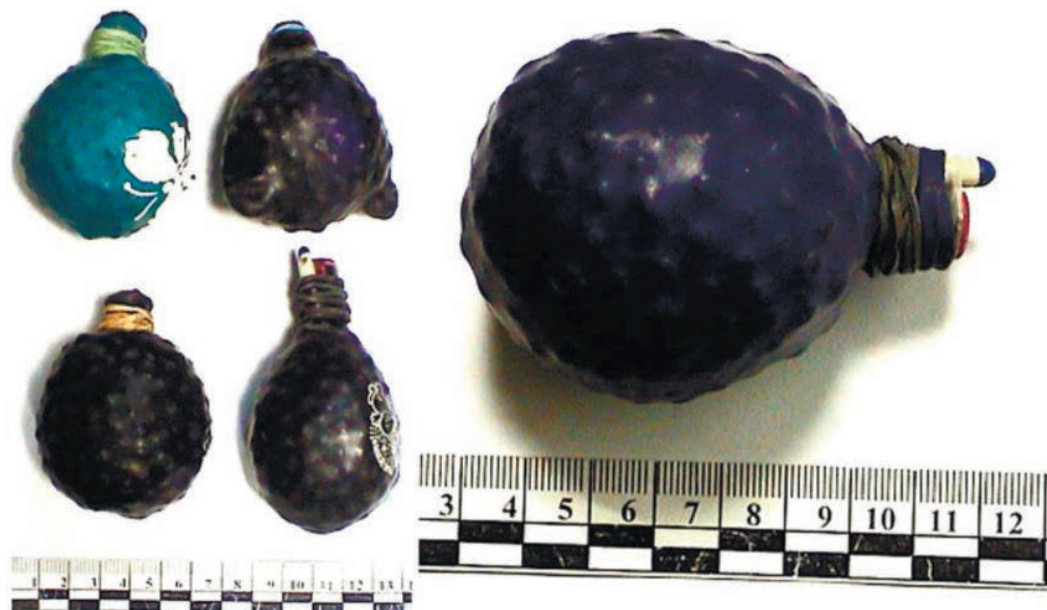
Рис. 2. Общий вид самодельных устройств сферической формы Fig. 2. General view of spherical improvised devices

менами гороха массой около 50 г (масса одной горошины ~0,15 г, диаметр ~6 мм).