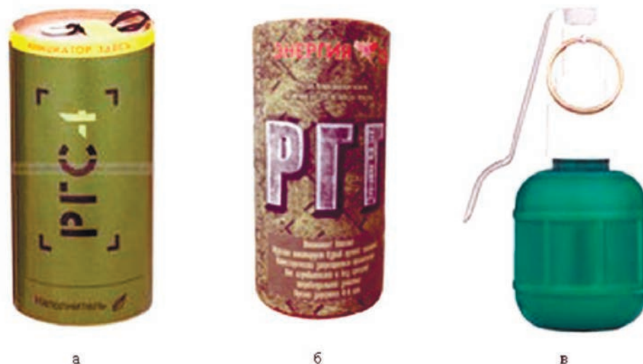
Рис. 4. Сертифицированные пиротехнические изделия для страйкбола, наполненные горохом (разрывной заряд – петарда «Корсар-4»): а – граната учебная страйкбольная РГС-4; б – граната учебная страйкбольная РГГ; в – граната учебная страйкбольная ГСП-Г (практическая) Fig. 4. Certified pea filled airsoft pyrotechnic devices (burst charge – «Korsar-4» firecracker): a – dummy airsoft hand grenade RGS-4; б – dummy airsoft hand grenade RGG; в – dummy airsoft hand grenade GSP-G (practice grenade)

ные гранаты классифицируются как имитационные пиротехнические изделия, взрывными устройствами не являются.