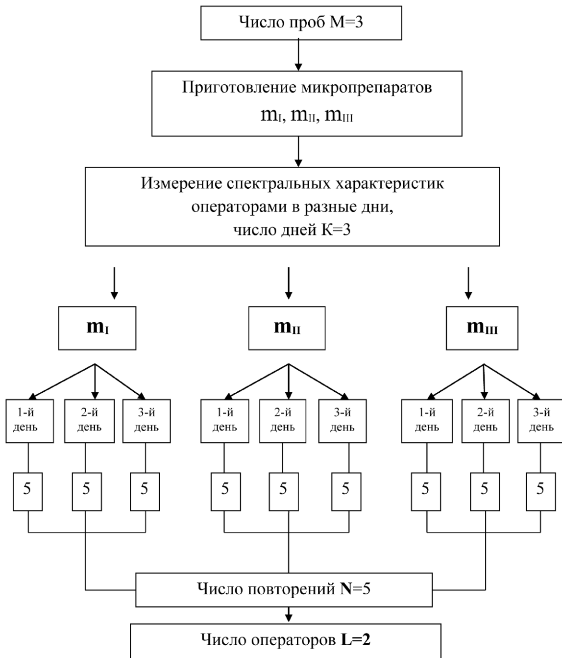
Рис. 1. Схема эксперимента Fig. 1. Flowchart of the experiment

Полученные статистические данные позволяют также объективно ответить на вопрос, какова разница между средними значениями оптической плотности, полученными разными экспертами в идентичных условиях. Для этого проверяется статистическая нулевая гипотеза об отсутствии расхождений, то есть о принадлежности результатов к одной генеральной совокупности. Значимость различия двух средних оценивали по t -критерию [4]. Расчетное