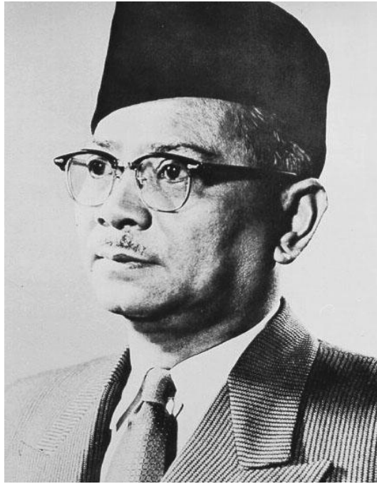
Tun Abdul Razak

Penyata Razak 1956 merupakan polisi yang telah dikeluarkan oleh Tun Abdul Razak. Polisi ini merupakan polisi yang sangat radikal dalam usaha membawa perubahan besar bagi sekolah-sekolah dengan matlamat utama untuk menyatupadukan rakyat. Antara perkara utama yang terkaandung di dalam penyata ini ialah mewujudkan dua jenis sekolah rendah iaitu Sekolah Rendah Kebangsaan (SRK) yang berbahasa pengantar Bahasa Melayu dan Sekolah Rendah Jenis Kebangsaan (SRJK) yang menggunakan Kuo-Yu, Tamil dan Inggeris sebagai bahasa pengantarnya. Namun Bahasa Melayu buat pertama kalinya diajar di semua Sekolah Jenis Kebangsaan. Ini adalah salah satu proses untuk menjadikan bahasa Melayu sebagai bahasa kebangsaan. Penyata Razak juga mencadangkan satu system pendidikan menengah dalam bahasa melayu sebagai bahasa pengantar. Dazar ini mendukung bahasa melayu sebagai bahasa kebangsaan dan juga menetapkan kandungan pelajaran yang sama di semua peringkat sekolah untuk menyemai semangat perpaduan dan kerjasama di kalangan murid-murid dalam pelbagai kaum. Hal ini kerana, apabila mereka semua mampu memahami bahasa melayu dengan baik, maka mereka juga mampu berkomunikasi dan bekerjasama dengan baik, lantas mencetuskan semangat perpaduan yang kukuh dalam kalangan mereka khususnya orang Melayu.