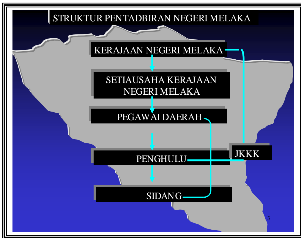
Rajah 1. Struktur Pentadbiran Negeri Melaka

Hubungan antara rakyat dengan pemimpin dalam konteks memilih wakil rakyat atau mengusulkan beberapa projek di peringkat negeri Melaka dapat diringkaskan dalam rajah di bawah. (Struktur Pentadbiran Negeri Melaka). Majlis Mesyuarat Kerajaan Negeri (MMKN) bolehlah dianggap seperti kabinet negeri. Ia diketuai oleh Ketua Menteri. Melalui MMKN inilah semua permohonan dari rakyat dibacakan dan diteliti untuk mendapat persetujuan. Jika ada cadangan daripada rakyat yang tidak dipersetujui atau mendapat bahu yang lantang dari pembangkang, maka perubahan terpaksa dibuat.