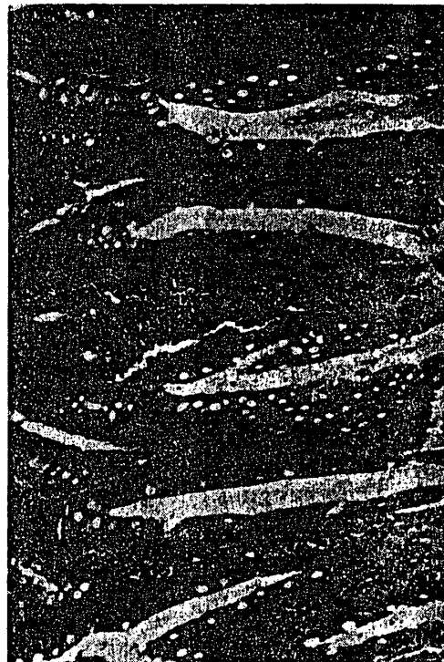
附図10 小腸, X130, 投与群(Ⅰ群-2で0.025%サリチル酸投与) 小腸絨毛の間質にリンパ球, 好酸球が多数見られ, 間質は多層性を示していた。