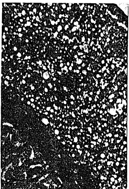
附図8 副腎, X130, 投与群(Ⅰ群-5で0.025%サリチル酸投与) 髓質の血管は拡張し血栓が観察された。その為に皮質は圧縮されて萎縮し, 写真に見られるような中程度のリポイド化が観察された。