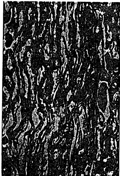
附図4 腎臓, X130, 投与群(Ⅲ群-3・0.2%サリチル酸投与) 集合管で中程度の細胞変性があり, 細胞境界が不鮮明で崩壊等が観察された。又蛋白円柱も見られた。