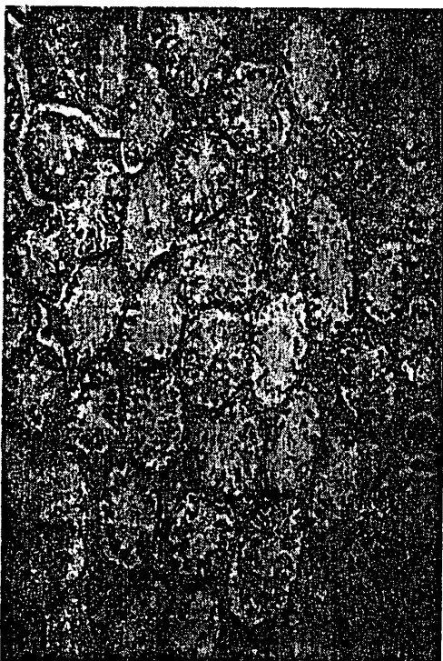
附図11 精巣, X52, 投与群(Ⅲ群-4で0.2%サリチル酸投与) 精細管の中で精祖細胞, 精母細胞, 精子細胞等の精細胞が減少し, 精子形成不十分が観察された。