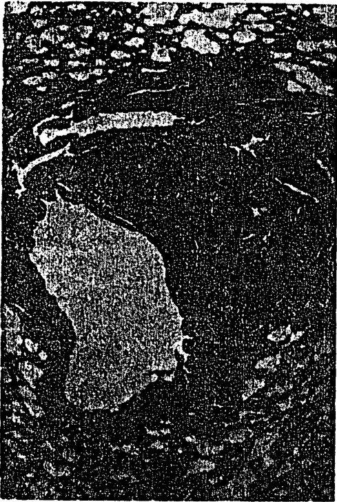
附図5 肺, X32, 投与群(Ⅲ群-5で0.2%サリチル酸投与) 慢性気管支炎で気管支のリンパ細胞に好酸球, リンパ球, 形質細胞が見られ, 浸潤をおこしていた。