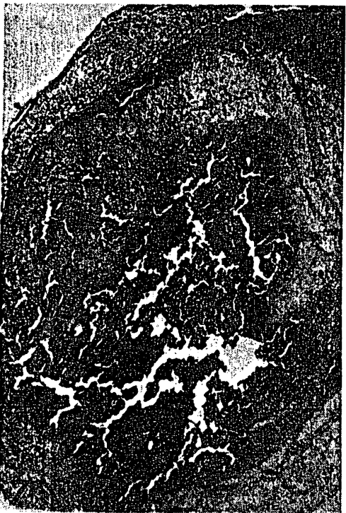
附図7 副腎, X32, 投与群(Ⅱ群-2で0.1%サリチル酸投与) 髓質の血管は拡張して血液が充満していた。その為に皮質は圧縮されて狭くなり, 又束状帯は軽度のリポイド化を認めた。