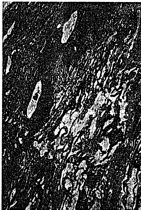
附図12 胸部腫瘍, X 32, 投与群(Ⅰ群-4で0.1%サリチル酸投与) 90週目に死亡。胸部から頸部にかけて腫瘍ができ, 90週目に死亡した。リンパ管腫で管腔には赤色の粘液様物が貯っていた。