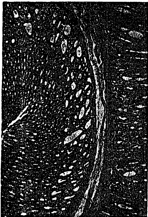
附図9 胃, X52, 投与群(Ⅱ群-2で0.1%サリチル酸投与) 胃腺の腺腔が拡大していた。しかし胃腺細胞の萎縮像は観察されなかった。