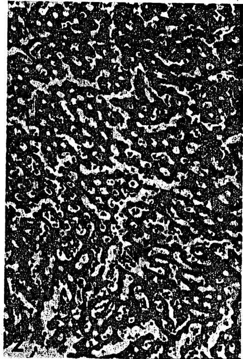
附図2 肝臓, X130, 投与群(Ⅲ群-5で0.2%サリチル酸投与) 被膜附近にある中心静脈の近くで類洞が拡張し肝細胞は萎縮していた。類洞にはリンパ球が多数観察された。