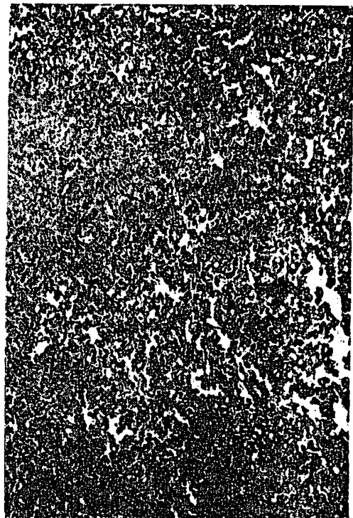
附図6 肺, X52, 投与群(Ⅰ群-5で0.025%でサリチル酸投与) 気管リンパ節から波及する悪性リンパ腫瘍で, 両肺共に肺の原型をとどめないぐらいの悪性リンパ腫瘍であった。