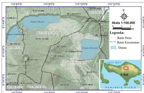
Gambar 1. Lokasi penelitian (sumber: data citra Pleiades 2014 Kebun Raya “Eka Karya” Bali & peta Rupa Bumi Indonesia, 2019).

Penelitian dilakukan pada tanggal 09 sampai 14 Maret 2015. Penelitian dilakukan di Desa Gobleg dan Munduk - Kecamatan Banjar, Desa Pancasari dan Desa Wanagiri - Kecamatan Sukasada serta Desa Candikuning - Kecamatan Baturiti. Desa ini berbatasan dengan kawasan hutan Danau, Buyan, Tamblingan dan Beratan. Lokasi penelitaian berada pada 8,224° - 8,320° LS dan 115,085° - 115,20° BT (Gambar 1.)