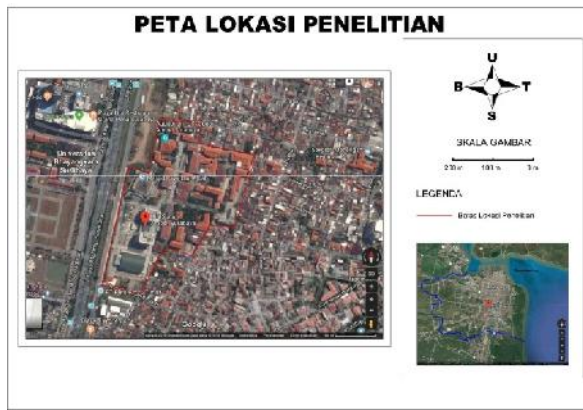
Gambar 1. Peta Lokasi Penelitian

Penelitian menggunakan beberapa data primer dan data sekunder, yakni: