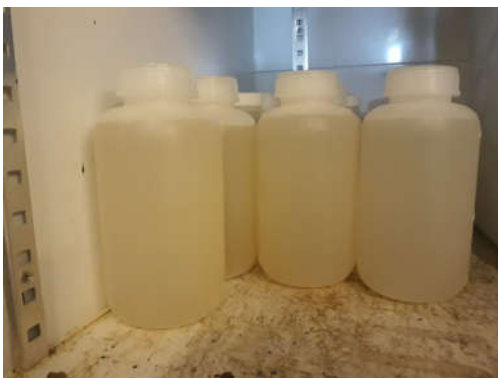
Gambar 2. Sampel Air Laut dalam Botol HDPE

Kemudian, sampel air laut tersebut dimasukkan ke dalam botol High Density Poly Ethylene (HDPE) , kemudian diawetkan dengan asam nitrat ( \text{HNO}_3 ) hingga pH mencapai 2 dan disimpan dalam ice box . Data klimatologi (curah hujan, arah, dan kecepatan angin) pada waktu pengambilan sample didapat dari Stasiun Metereologi Perak I Surabaya. Jumlah industri diperoleh dari hasil sekunder melalui Dinas Perindustrian Kabupaten Gresik.