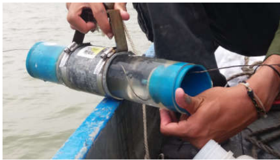
Gambar 1. Nansen water sampler

Sampel yang diambil berupa air laut yang diambil di kawasan perairan yang padat dengan aktivitas industri. Jumlah titik sampel yang diambil adalah 3 titik, yaitu di daerah Kecamatan Manyar, Pelabuhan PT Petrokimia Gresik, dan sekitar Kawasan Industri Maspion V. Pengambilan sampel dilakukan pada pagi hari pukul 07.00 - 10.00 WIB. Pukul 07.00 hingga 10.00 WIB dipilih karena pada jam-jam tersebut digunakan manusia untuk beraktivitas, baik aktivitas di rumah maupun aktivitas di lingkungan industri. Pengambilan sampel dilakukan dengan metode purposive sampling . Air laut diambil menggunakan nansen water sampler .