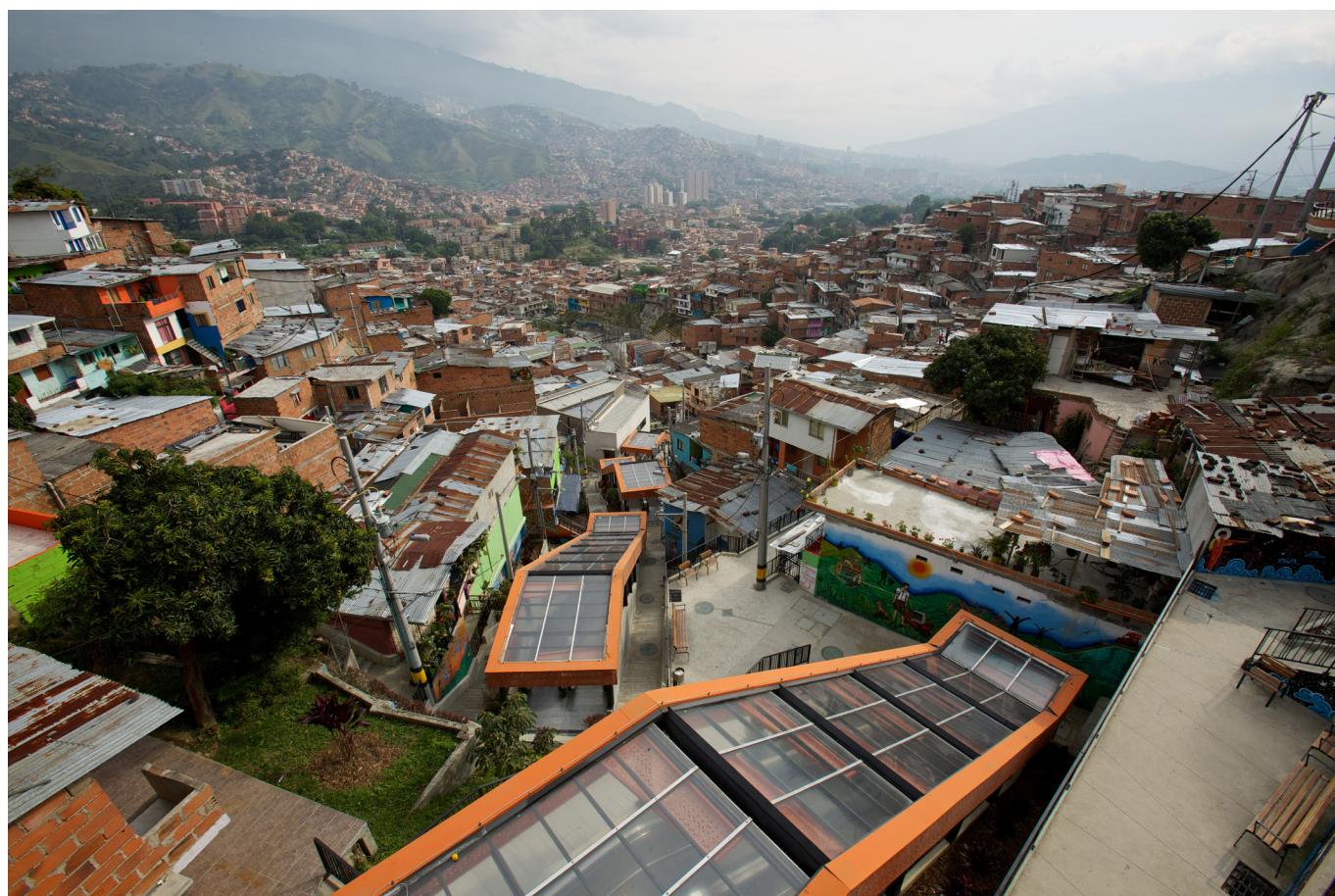
Escadas rolantes da Comuna 13, 2014.

O governo municipal aumentou a rede de mobilidade com novos corredores de transporte público de média e alta capacidades, que, como o Metrocable (Teleférico) ou o Metroplús (uma espécie de BRT), conectaram estes bairros isolados ao sistema integrado do metrô de Medellín. A experiência de atravessar a cidade e torná-la visível foi uma ferramenta física e psicológica muito potente para iniciar o processo de inclusão das comunidades marginalizadas. Este primeiro passo