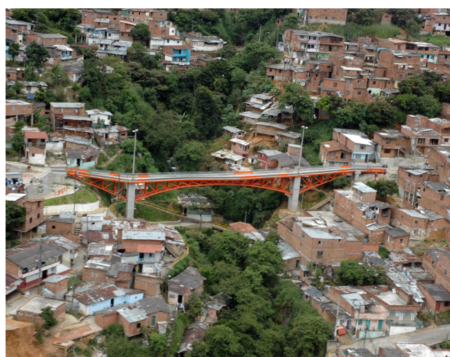
Ponte Bairros Andaluzia e França, Comunas 1 e 2.

A estratégia de Urbanismo Social liderou a confluência desses processos em zonas estratégicas, buscando articular harmonicamente os diferentes programas com os projetos de transformação física. Nós nos apoiamos muito no sentido comum, definindo como tática principal, restaurar a dignidade dos itinerários urbanos mais intensamente utilizados pelas pessoas dos bairros e