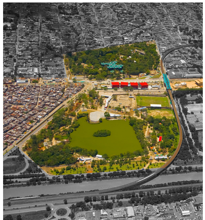
Foto aérea Explora

A base do sucesso dos meios de colaboração entre as comunidades e o governo, entre as equipes técnicas e os líderes locais está na habilidade para se construir espaços fundamentados no respeito e em