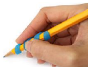
Figura 28: Ippo coiled pencil grip