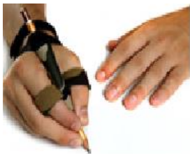
Figura 23: Adaptação para escrita