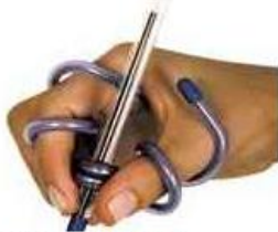
Figura 3: Aranha Mola

Abaixo serão apresentadas as imagens dos artefatos selecionados para análise.