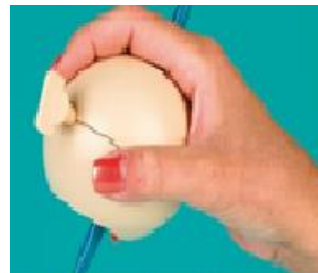
Figura 15: arthwhiter