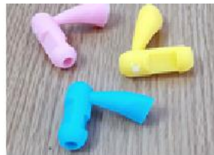
Figura 24: Lápis ergonômico universal