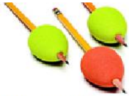
Figura 21: Abilitations egg ohs!