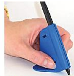
Figura 12: Lápis escrita firme