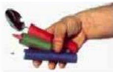
Figura 4: Engrossadores