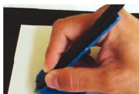
Figura 10: prancheta com adaptação imantada para escrita