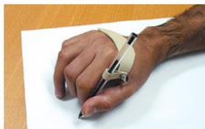
Figura 9: Auxiliar para escrita slip on