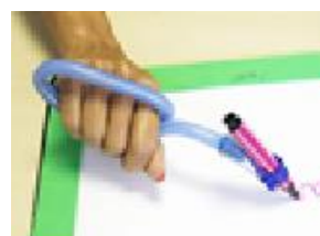
Figura 19: Tuboform gama