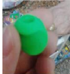
Figura 1: Engrossador

Quanto ao levantamento no Comércio Recifense, foram visitadas 6 papelarias, localizadas respectivamente nas seguintes avenidas e bairros: 1 – Avenida Conde da Boa vista, Boa vista; 2 – Avenida Conselheiro Aguiar, Boa viagem; 3 – Rua velha, Boa vista; 4 – Avenida Caxangá, Madalena; 5 – Avenida Dantas Barreto, Santo Antônio; 6 – Avenida Dantas Barreto, Santo Antônio. Adaptações foram encontradas apenas nos estabelecimentos 2 e 3: