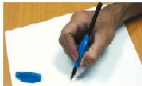
Figura 6: Adaptação bulbo