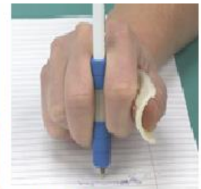
Figura 16: Ergowriter