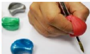
Figura 8: Adaptação crossover