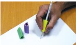
Figura 7: Adaptação triangular