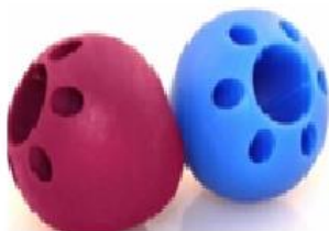
Figura 29: Butter Grip