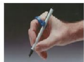
Figura 14: ring writer clip