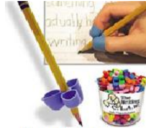
Figura 11: lápis garra