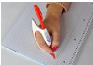
Figura 25: Ring pen ultra