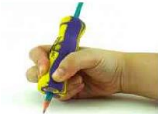
Figura 5: Engrossador anatômico