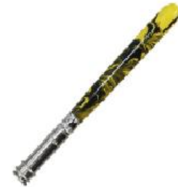
Figura 2: Extensor de lápis Keramik

Seguimos, portanto, com a Análise do Design dos Produtos selecionados, encontrados online.