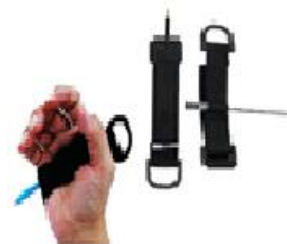
Figura 17: Tira para adaptação de lápis