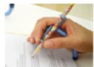
Figura 20: Tuboform delta