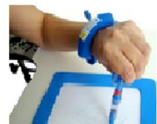
Figura 18: Tuboform facilitador de punho e polegar