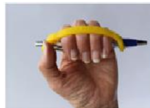
Figura 13: eazyhold