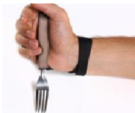
Figura 27: Adaptação universal