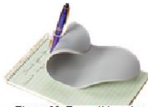
Figura 22: Easy glide writer