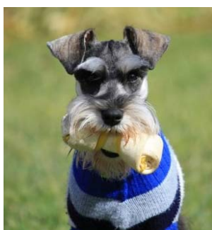
Figura 1. Fotos del cachorro Schnauzer miniatura en la actualidad.

El cachorro, macho, de raza Schnauzer Miniatura (figura 1), fue alimentado con una dieta regular basada en balanceado completo para cachorros de razas pequeñas desde el destete hasta los 10 meses. Los ingredientes del alimento balanceado incluían proteínas de ave, gluten de maíz, levaduras, huevo, aceite de pescado, fructosa y pulpa de remolacha. El aporte calórico reportado para el balanceado es de 4300 Kcal/kg y un contenido de proteínas, almidón y grasas del 33%, 25% y 20% respectivamente. El cachorro no recibió medicamentos de forma regular y su esquema de vacunación se encontraba completo para su edad.