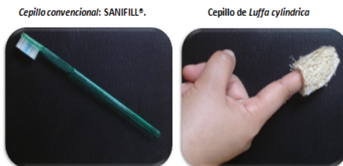
Figura 1. Elementos de higiene. Evaluación clínica de la eficacia del cepillo de esponja vegetal ( Luffa cylindrica . L Roem) en la remoción de placa supragingival. Paraguay,2010

Previo al uso del CEV se recomendó la aplicación de alcohol en gel en las manos. Los CEV fueron desinfectados con disolución de hipoclorito de sodio al 0,5%, luego de su confección y posteriormente incluidos en bolsitas individuales teniendo en cuenta las consideraciones higiénicas pertinentes. Fase III. El sujeto regresó al examen final, donde el examinador sin conocimiento del elemento de higiene utilizado, procedía a 1. ) Verificar la presencia de lesiones en la mucosa, 2.) Realizar la medición de la placa final siguiendo la misma sistemática para la medición de la placa basal. En la hoja 2 se calculó el residuo de placa ( P_i - P_f ) dando como resultado el porcentaje de placa removida ( (P_f \times 100/P_i) ) que es la variable resultante calificada según el grado de remoción de placa ( Óptimo > 20%; intermedio 21 hasta 50%; inadecuada 51 y más).