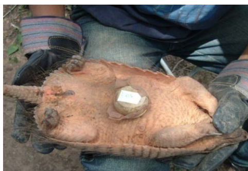
Figura 2. Xenodiagnóstico realizado a un armadillo.