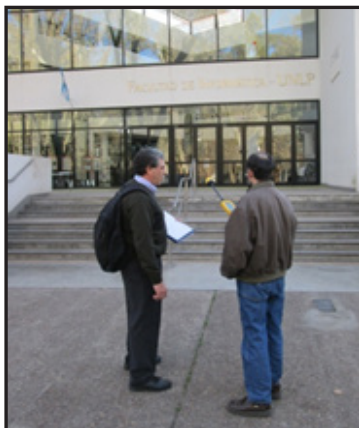
Figura 1. Medición en ambientes externos en la facultad de Informática.

http://archivos.med.unlp.edu.ar/spinelli/rni_2.mp4