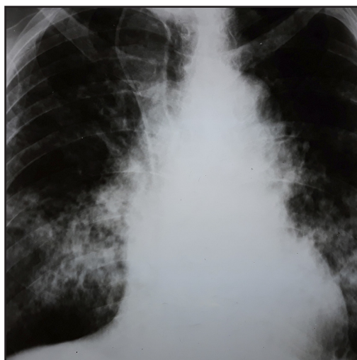
Figura 7. Radiografía, de tórax. Importante compromiso por paracoccidioidomicosis

Radiografía de tórax: Infiltrado intersticial difuso a predominio de base pulmonar derecha y campo medio (Figura 7).