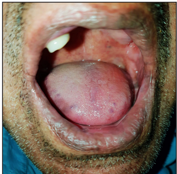
Figura 1. Hiperpigmentación de piel, labios y mucosa oral.

Al examen general llamaba la atención la hiperpigmentación generalizada de la piel y de la mucosa oral (Figura 1). PA: 100/60 mm Hg, FC: 78 lat/min.