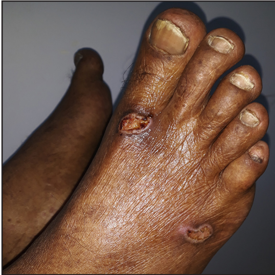
Figura 2. Lesiones ulcerosas en pie derecho Hiperpigmentación.