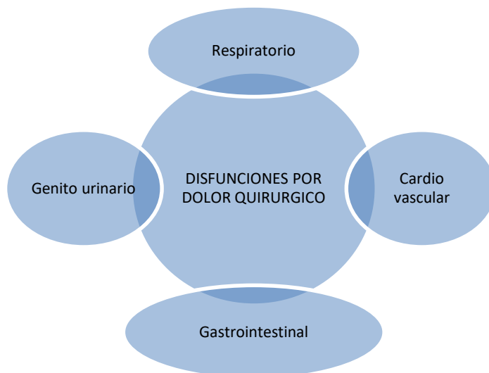
GRAFICO 2 Disfunciones por dolor quirúrgico