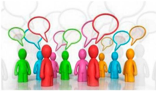
Figura 2. Comunidades Virtuales