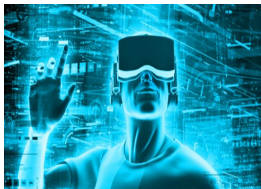
Figura 1. Realidad Virtual