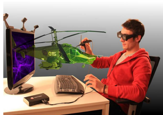
Figura 3. Sistema de Realidad Virtual de Escritorio

Base a todo esto, existen varios cuestionamientos que debemos hacernos, el más importante es ¿Podremos en algún punto diseñar nuestras propias aplicaciones para adaptarlas a nuestros modelos educativos? La respuesta es sí. Actualmente el nivel de desarrollo de sistemas de nuestros profesionales y estudiantes universitarios es muy bueno, en base a esto se pueden realizar convenios con instituciones de educación superior para realizar diferentes programas adaptables para correr aplicaciones de realidad virtual en celulares de gama baja y así poder completar procesos de enseñanza adaptados a nuestra realidad nacional. Se pueden tratar de programas que traten de nuestras culturas precolombinas, visitas de 360 grados hacia lugares autóctonos como las Ruinas de Ingapirca, o ciudades emblemáticas de nuestro país, museos y recorridos virtuales, y en fin, un universo de posibilidades en áreas teóricas y prácticas. Pudiendo realizar programas que permitan conocer elementos propios de cada área técnica, el cual puede ser visualizado en realidad virtual en tercera dimensión, con lo que se experimentaría un mejor conocimiento de elementos que no son de fácil alcance. Villarroel (2016)