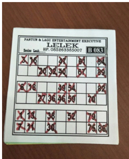
Gambar 1. Contoh kupon yang telah ditandai secara keseluruhan (penuh)

penerang, kompor, sepatu, pakaian, tas dan lain-lain. Properti ini harus diberikan kepada pihak yang menang.