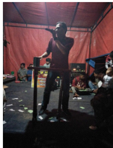
Gambar 9. Meja tempat kaleng batu kuncang yang harus ada di pentas tempat pertunjukan Kim

Bentuk hadiah biasanya sesuai dengan kemampuan tuan rumah dan teman-teman sehoobi tanpa memperhitungkan besar atau kecil hadiah yang diperebutkan. Hadiah-hadiah tersebut diberikan secara cuma-cuma kepada penonton atau peserta yang dinyatakan menang dalam permainan. Dapat ditegaskan di sini bahwa para penonton atau peserta yang ikut bermain tidak dipungut bayaran sepeser pun, karena tujuan dari pertunjukan ini adalah untuk hiburan semata.