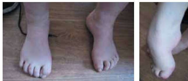
Рис. 2. Деформации стоп по типу «полых» у пациентов

Мы провели клиническое обследование 9 больных в возрасте 16–52 лет, которое позволило проследить динамику возникновения клинических симптомов по мере прогрессирования НМСН. У всех пациентов была отмечена деформация стоп по типу «полых» (рис. 2), гипотрофия мышц нижней трети голени и нерезко выраженная гипотрофия межкостных мышц кистей. Деформацию кистей рук по типу «когтистой лапы» наблюдали только у 1 больной в возрасте 52 лет