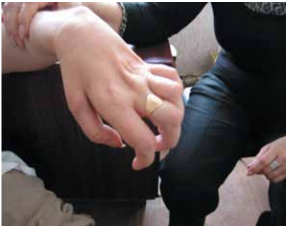
Рис. 3. Деформация кистей по типу «когтистой лапы»

с продолжительностью заболевания 40 лет (рис. 3). Ряд других авторов также отмечали длительный период сохранности дистальных отделов мышц верхних конечностей у пациентов с НМСН типа 2Е [9]. Особенность клинических проявлений у больных обследованной нами семьи — отсутствие значимых расстройств чувствительности в дистальных отделах конечностей. Снижение поверхностной и глубокой чувствительности отмечено только у 1 пациентки с грубой деформацией кистей и стоп. У остальных больных в возрасте 16–42 лет наблюдали лишь нечеткую поверхностную гиперестезию в кистях и стопах, при этом сухожильные рефлексы с ног не вызывались, а с рук были не изменены. У всех пациентов была нерезко выраженная сенситивно-мозжечковая атаксия в виде неустойчивости в позе Ромберга, интенционного тремора пальцев кистей, дисметрии и адиадохокинеза. Ни у одного больного не выявлены симптомы поражения центральной нервной системы и черепно-мозговых нервов.