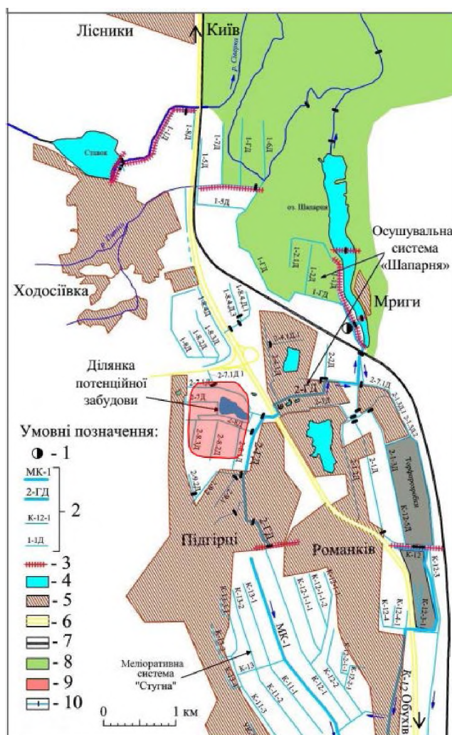
Рис. 1. Схема розташування ділянки перспективної забудови в с. Підгірці на території меліоративної системи «Шапарня»:

Раніше ці землі відносилися до осушуваних сільськогосподарських угідь меліоративної системи «Шапарня», зокрема до дренажної системи головного колектора 2-ГД (рис. 1).