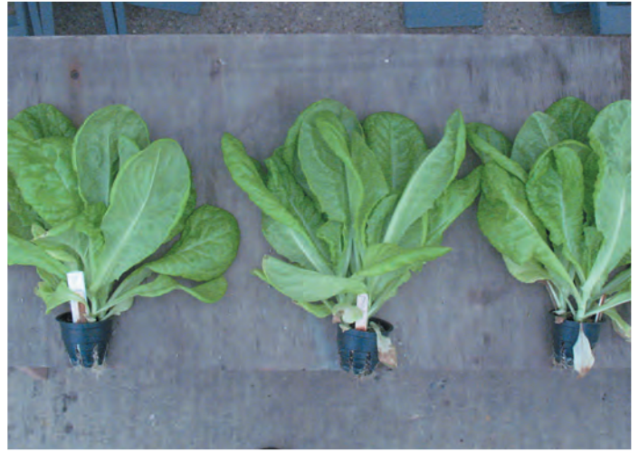
Сорт Московский парниковый