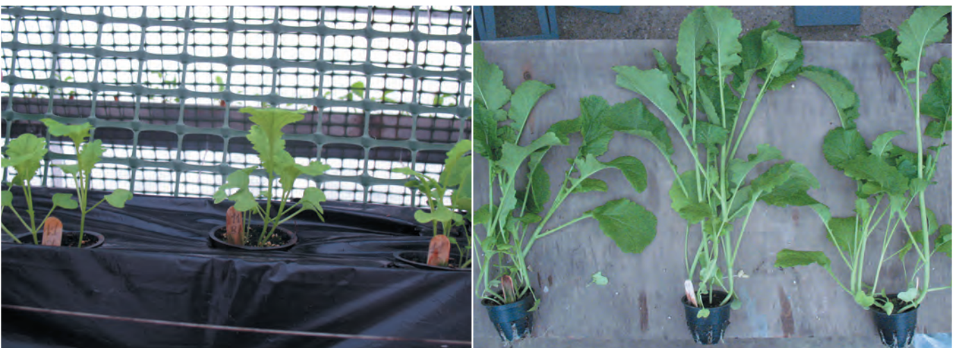
Fig. 5. Appearance of Indus plants of the Rusalochka sowing variety when grown on MUG: a) on the 14th day of vegetation; b) on the 30th day of vegetation.