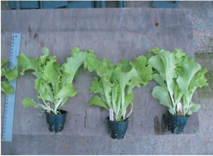
Сорт Афицион – st

Масса растений салата при выращивании на МУГ в данном эксперименте связана в основном с условиями досветки, так как известно, что увеличение долготы дня от 12 часов и более приводит к увеличению массы растения и содержания в ней сухого вещества [13]. Больше массой листьев отличались сорта Московский парниковый, Опал и Букет, у которых масса листьев на