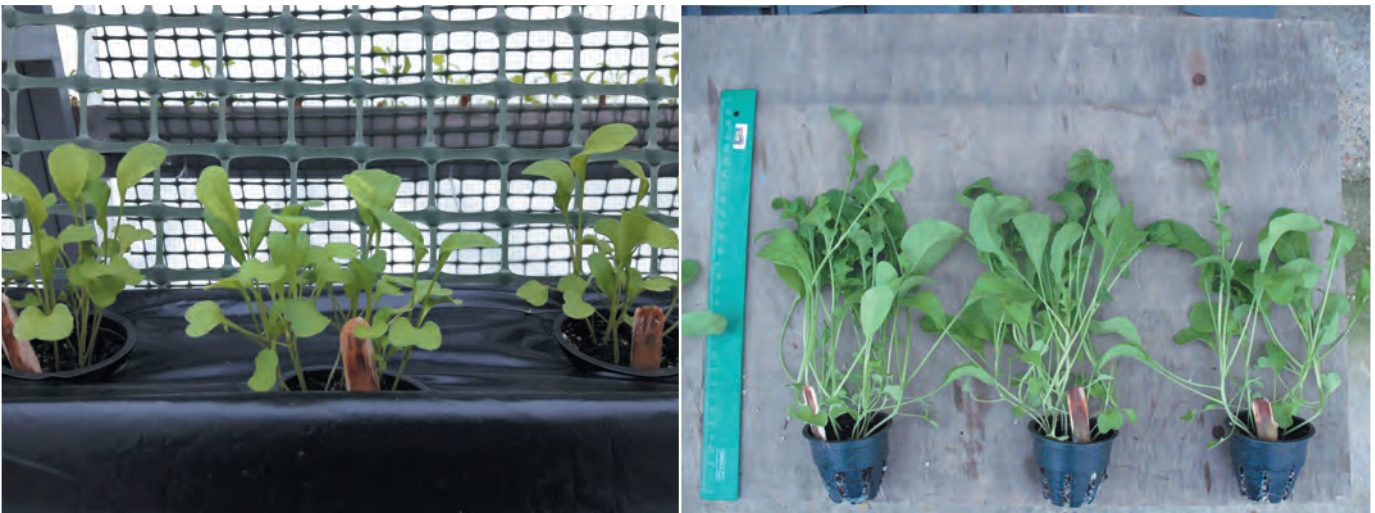
Fig. 4. Appearance of cress plants of Prestige variety when grown on MUG: a) on the 14th day of vegetation; b) on the 30th day of vegetation.