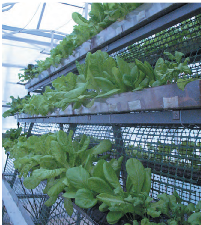
Рис. 1. Внешний вид установки МУГ с растениями салата и пряно-вкусовых культур. Fig. 1. The appearance of the installation MUG with plants of lettuce and spicy-flavor cultures.