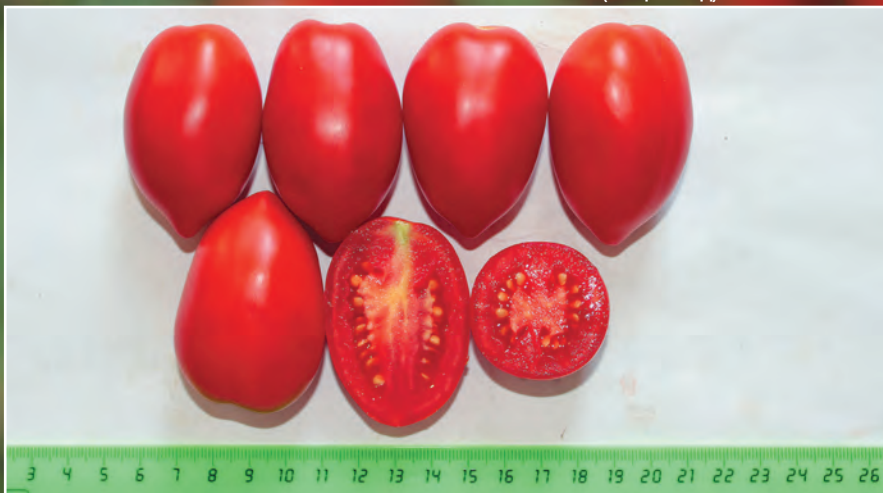
Плоды линии 909.14