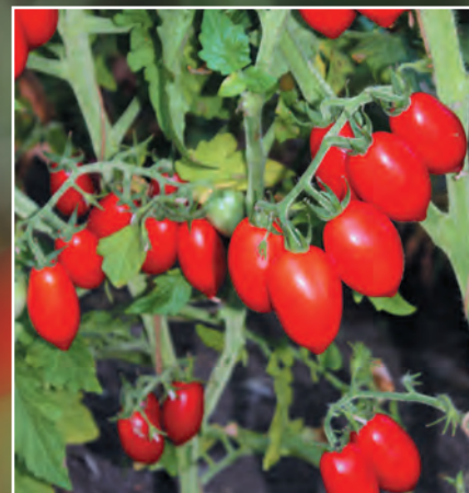
Линия 909.14 (общий вид)