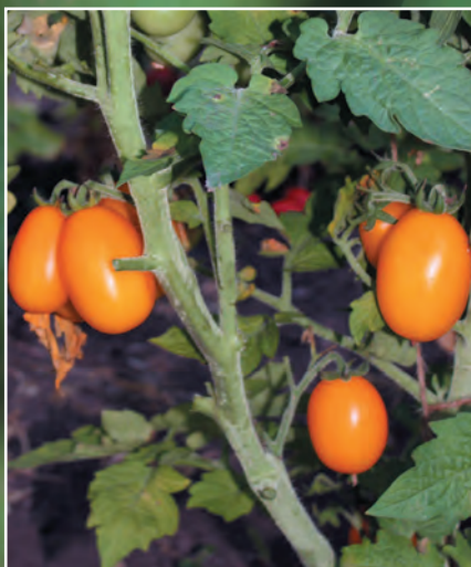
Линия 911.14 (общий вид)

В мировой коллекции томата насчитывается более 200 штамбовых сортов и гибридов. В