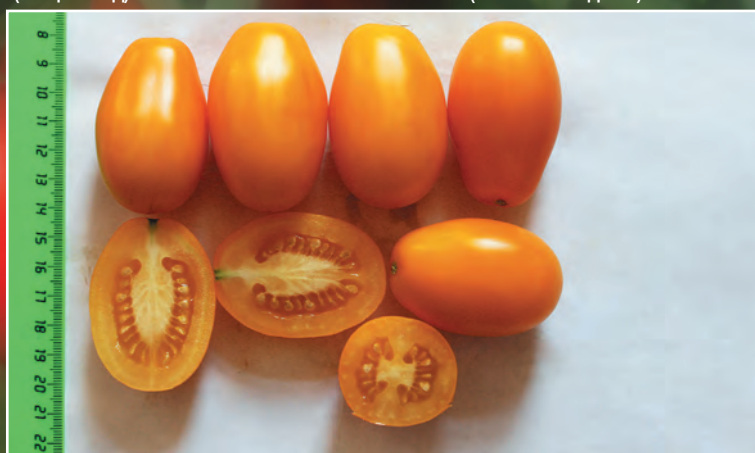
Плоды линии 911.14