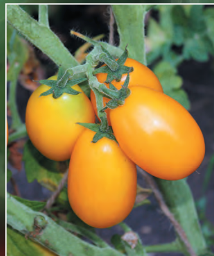
Линия 911.14 (кисть с плодами)