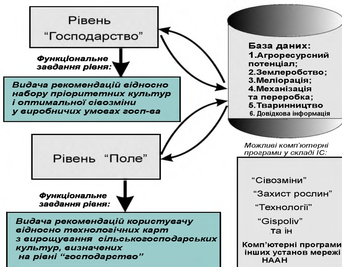
Рис.1. Загальна структура функціонування ІС

цьому враховуються як економічні пріоритети та побажання господарства, так і екологічні обмеження, які існують на даній території. Тобто відбувається визначення економічно доцільних та екологічно обґрунтованих площ посівів для обраного складу культур та їх розміщення у вигляді сівозмін.