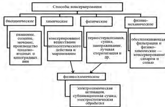
Рис. 1. Основные способы консервирования фруктов и овощей. Fig. 1. The main methods of canning fruits and vegetables.

Так, например, для поддержания оптимальных условий хранения большей части овощных культур необходимо поддержание постоянной температуры воздуха в пределах от 0 до +5°C. Однако современные достижения науки и техники позволяют значительно продлить срок годности товаров путем использования специальных приспособлений и устройств, а также путем озонирования и химической поверхностной обработки.