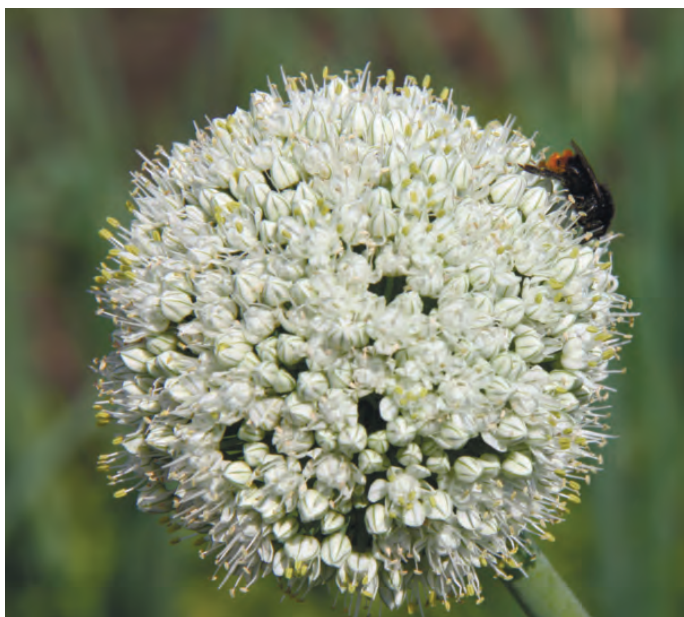
Рис. 1. Фертильное соцветие лука репчатого. Fig. 1. Fertile inflorescence of onions.

Широкое распространение гибридов F_1 в товарном производстве лука репчатого в Японии, Нидерландах и других странах, а также исследования, проведенные в России, показывают большое преимущество гибридов по продуктивности, выравненности гибридов по вызреванию, размеру, форме и качеству луковицы по сравнению с сортами. По данным разных исследователей, повышение продуктивности гибридов составляло 39-52%. Так как получение гибридных семян при искусственном опылении затруднено из-за кастрации цветков и в производственных масштабах невозможно, наиболее целесообразным является создание гибридов на основе мужской стерильности. В селекционной практике наиболее распространенным способом получения таких гибридов является использование в качестве материнских форм линий, обладающих цитоплазматической мужской стерильностью (CMS).