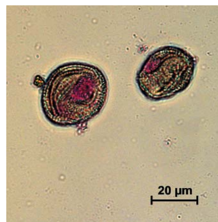
Стерильные пыльцевые зёрна