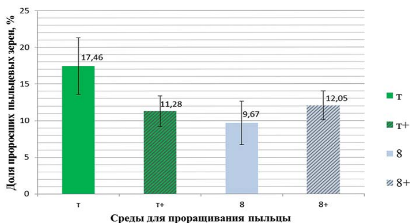
Рис. 2. Влияние различных сред на прорастание пыльцевых зёрен капусты белокочанной сорта Зимовка 1474

Таким образом, было показано, что использование среды Т для проращивания пыльцевых зёрен капусты белокочанной при самоопылении растений с низким содержанием жизнеспособной пыльцы является одним из способов получения семенного потомства.