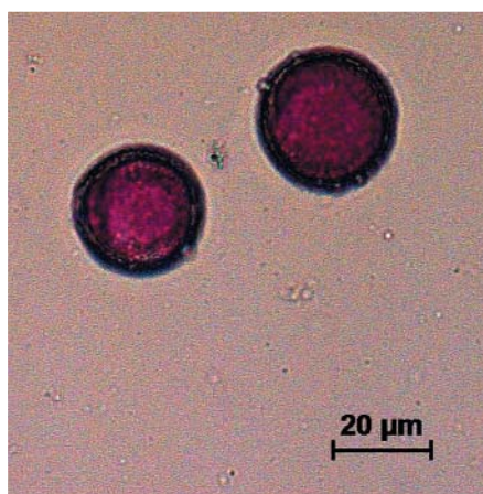
Жизнеспособные пыльцевые зёрна