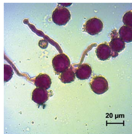
Рис.3. Прорастание пыльцы капусты белокочанной сорта Зимовка в среде Т