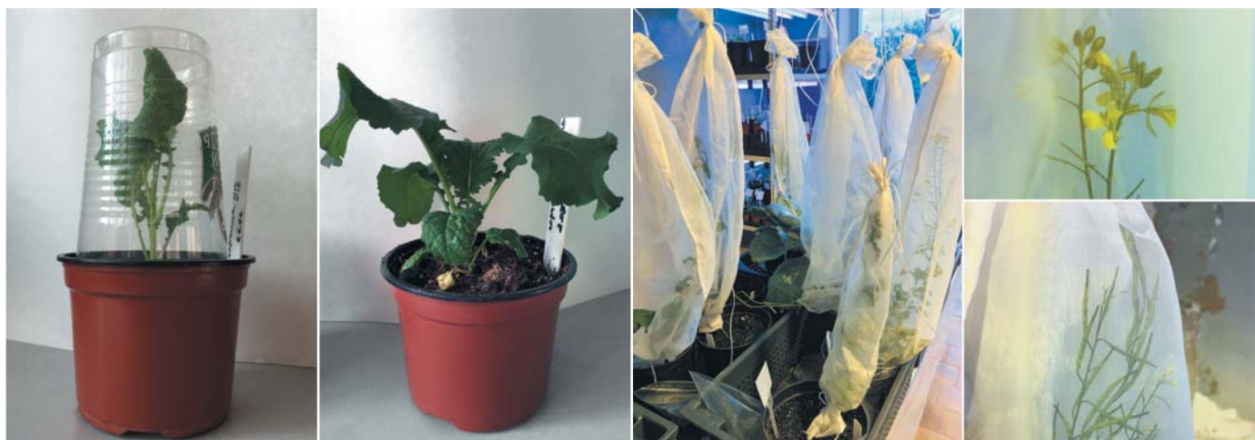
Рис. 4. Адаптация растений-регенерантов горчицы к условиям in vivo Fig. 4. Adaptation of plants-regenerants in vivo