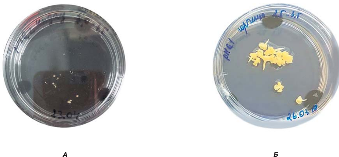
Рис. 2. Образовавшиеся в культуре микроспор эмбрионды на семядольной стадии развития на жидкой питательной среде NLN-13: А – индау посевной ( Eruca sativa ), Б – горчица сарептская ( Brassica juncea ) Fig. 2. Microspore-derived embryos at the cotyledon stage on the NLN-13 liquid medium A – rocket salad ( Eruca sativa ), Б – sarepta mustard ( Brassica juncea )