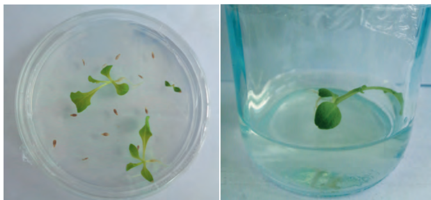
Рис. 1. Проростки салата сорта Букет через 7 и 11 суток, полученные на среде Gamborg B5 (2% сахарозы, 3,0 г/л фитогеля). Fig. 1. Sprouts of Buket variety lettuce after 7 and 11 days, obtained on Gamborg B5 medium (2% sucrose, 3.0 g/l phytoigel).

В ФГБНУ «Федеральный научный центр овощеводства» в лаборатории репродуктивной биотехнологии в селекции сельскохозяйственных растений начаты исследования по клональному микроразмножению салата (Романова и др., 2019), чтобы в дальнейшем этот этап вошел в протокол получения гаплоидных растений салата через культуру in vitro .