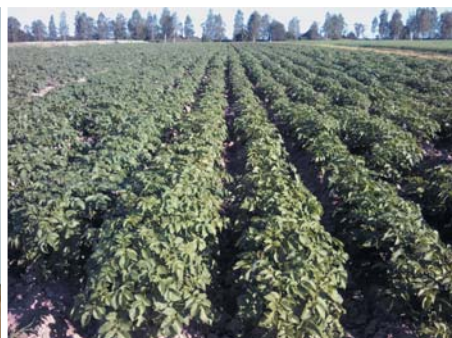
Рис. 1. Клубни и растения среднераннего сорта картофеля Смоляночка Fig. 1. Tubers and plants of middle-early variety of potatoes Smolyanochka

дуктивность нового сорта картофеля Смоляночка вели в 2017-2018 годах на базе Смоленского ИСХ (бывш. Смоленской ГОСХОС) (табл. 1).