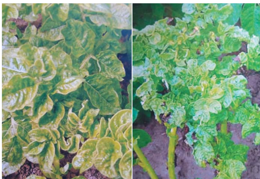
Рис. 3. Слева направо: мозаичное закручивание листьев, морщинистая мозаика Fig. 3. From left to right: mosaic twisting of leaves, wrinkled mosaic