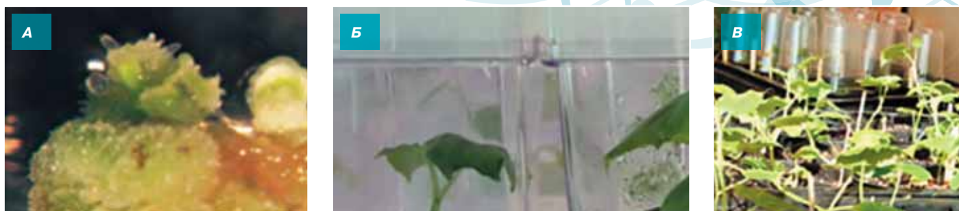
Рис. 1. Получение ДН-растений огурца в культуре неопыленных семяпочек. Прорастание семяпочки на среде МСм с 0,2 мг/л ТДЗ и 0,0001 мкМ эпибрасинолида (А). Развитие саженцев на без гормональной среде МС (Б). ДН-растения огурца (В).

гомозиготных родительских линий, получение которых традиционными методами трудоемкое и длительное (6-8 лет), что сильно тормозит селекционный процесс.