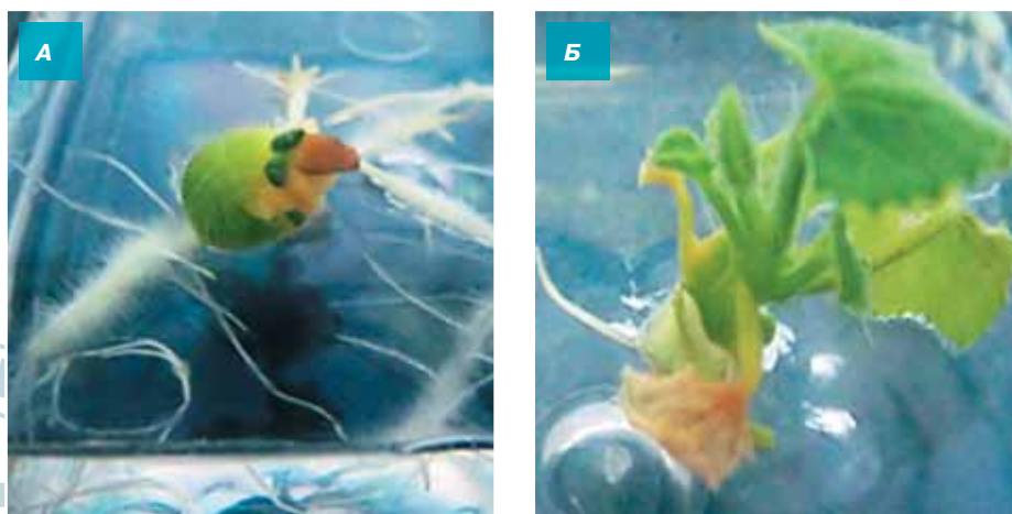
Рис. 2. Получение ДН – растений тыквы в культуре неопыленных семяпочек. Проращивание семяпочки на среде МСм с 0,2 мг/л ТДЗ и 0,0001 мкМ эпибрассинолида (А). Развитие проростка гибрида № 100 на без гормональной среде МС (Б).

Применение для индукции гиногенеза 0,2 мг/л тидиазурона в сочетании с 0,0001 мкМ эпибрассинолида позволило повысить регенерационную способность семяпочек. Полученные результаты превышали данные эксперимента, проведенного по методике Gemes Juhans с коллегами (2002) в несколько раз (3-20 раз в зависимости от образца) (табл. 1).